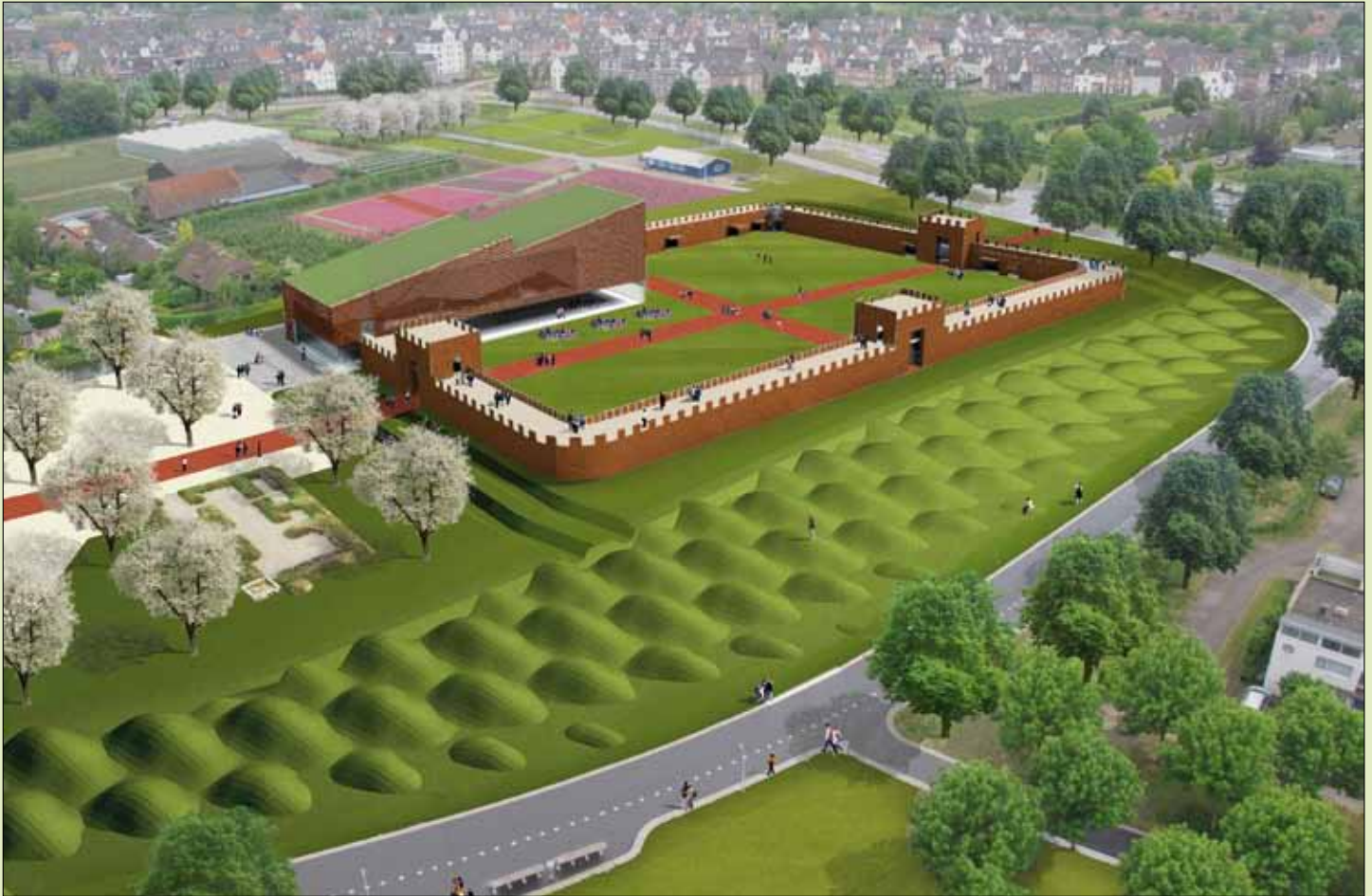
Het ontwerp van Architectuurstudio Skets voor archeologisch activiteitencentrum Castellum Hoge Woerd

□ PROJECTBUREAU LEIDSCHER RIJN UTRECHT | GEMEENTE UTRECHT