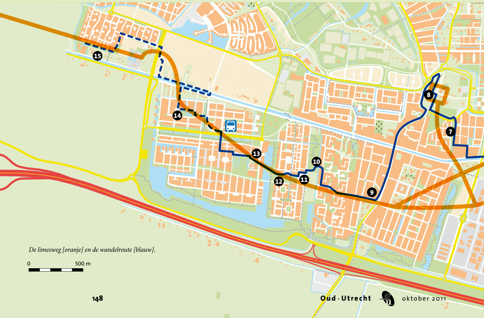
De limesweg [oranje] en de wandelroute [blauw].

3 Hier komen vele historische tijdvakken bij elkaar. We bevinden ons in een van de oudste ontginningsgebieden in de provincie, daterend uit het derde kwart van de 11e eeuw. In de verte, in de buurt van het sportpark, stortte