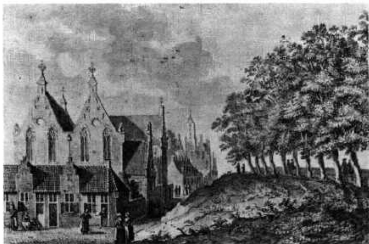
Gezicht op het Leeuwenberghpestgasthuis, de wal, het huis Lepelenburch en de Bruntenhof. J. de Beijer, 1744. G. A. U. Top. Atlas Zk 13.10.

Tegen deze achtergrond is het geenszins verbazingwekkend dat de regenten reeds de volgende dag in