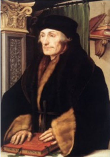
Erasmus, in 1523 geportretteerd door Hans Holbein de jongere