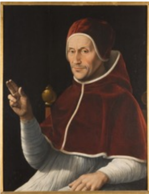
Adrianus VI, 16e-eeuwse kopie naar een portret van Jan van Scorel uit 1523

In 2015 bestaat het Prins Bernhard Cultuurfonds 75 jaar. De afdeling Utrecht wil dat vieren met een bijzonder cultuurproject door de inwoners van Utrecht een beeld aan te bieden van Paus Adrianus VI (Utrecht 1459 - Rome 1523). Anno 2014 is deze beroemde Utrechter vrijwel onzichtbaar in de stad, terwijl er meerdere redenen zijn voor een prominente aanwezigheid als historische figuur met actuele betekenis. Voor het ontwerp en de uitvoering van het beeld is onder kunstenaars een opdracht uitgeschreven.