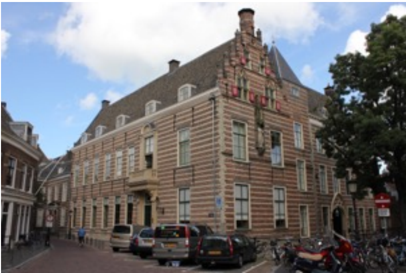
Paushuizen, Pausdam Utrecht