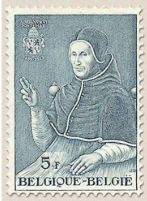
Postzegel in 1959 uitgegeven t.g.v. Adrianus' 500e geboortedag