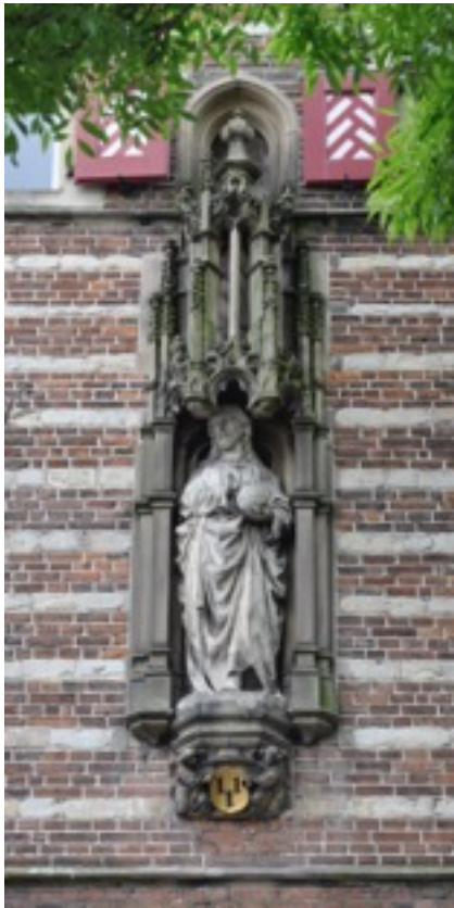
Beeld St. Salvator in de zuidgevel van het Paushuize

Terwijl hij in Spanje zat, dacht Adrianus aan een permanente terugkeer naar de Domstad. In januari 1517 kocht hij daaom een huis binnen de immunititeit van Sint-Pieter. Hij liet het slopen en een nieuwe woning bouwen, het linkerdeel van het huidige Paushuize (met de lange gevel aan de Pausdam). In de zuidgevel liet hij een beeld van St. Salvator plaatsen, waarmee hij uitdrukking gaf aan zijn grote wens de rest van zijn leven God te dienen als proost van Oudmunster.