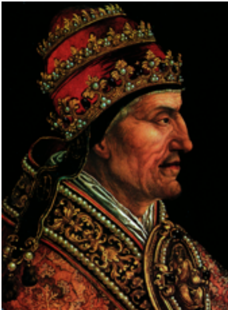
Portret Paus Adrianus VI uit 1523, toegeschreven aan Jörg Breu de Oude