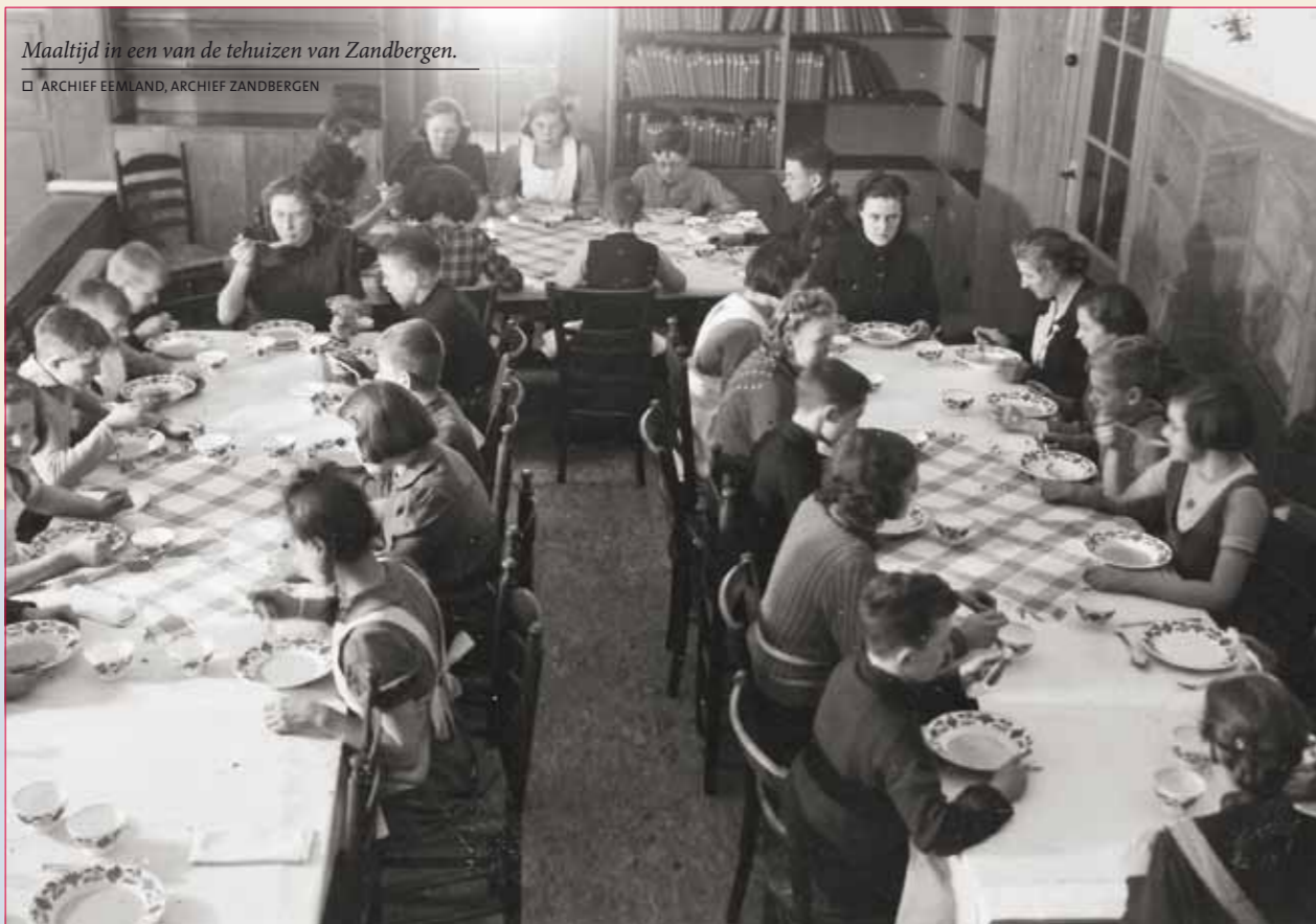
Maaltijd in een van de tehuizen van Zandbergen.