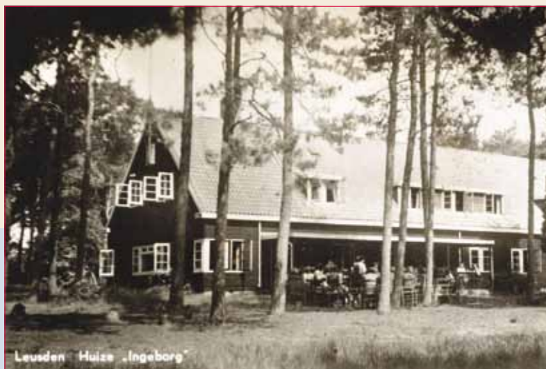
Huize Ingeborg aan de Paradijsweg in De Treek, Leusden, eind jaren 40.

□ ANSICHTKAART | COLLECTIE ARCHIEF EEMLAND