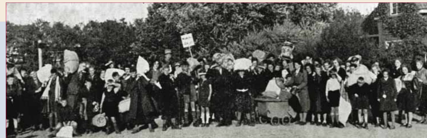
Kinderen en medewerkers van Zandbergen klaar voor de evacuatie, 13 mei 1940.

Publicist en eindredacteur van dit tijdschrift.