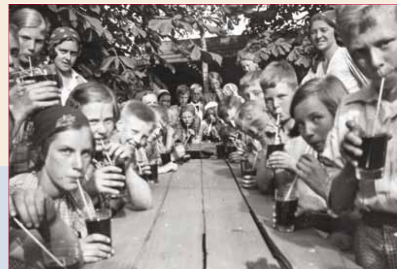
Kinderen van Zandbergen tijdens een uitstapje, mogelijk in de zomer van 1944.

Naarmate de oorlog vordert, groeit het aantal notities over confrontaties met Duitsers die panden willen vorderen (8-3-1944: 'Militaire overheid betoont angstwekkend veel belangstelling voor Zandbergen') of jongens willen recrute-