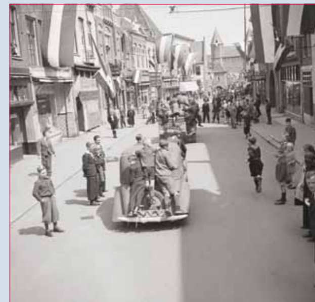
Canadese troepen op 7 mei in de Langestraat. Het oorlogsdagboek van die dag: 'De hele stad wordt opgewonden, eindelijk voelt men de zekerheid. Ook hier in St. Joseph en onze jongens racen om zo snel mogelijk in de stad te komen.'