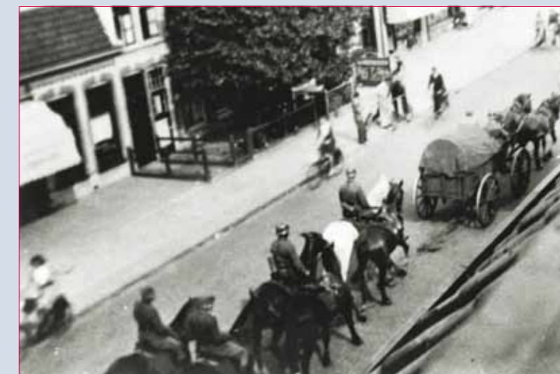
Duitse troepen in Amersfoort op de Leusderweg waaraan ook het tehuis Trekerbergje lag.

Als Duitsland Nederland binnenvalt, treedt voor Amersfoort een evacuatieplan in werking. De stad ligt in de vermoedelijke gevechtszone en daarom moeten 44.000 personen zo snel mogelijk vertrekken. De kinderen en