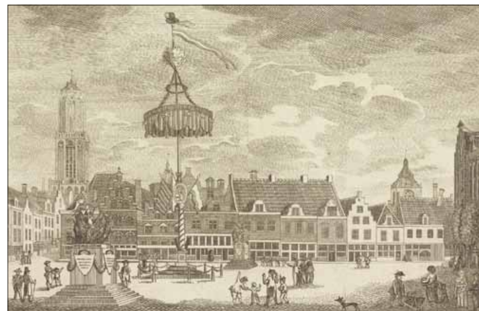
Vrijheidsboom op de Neude, hernoemd tot het 'Vrijheidsplein', voorjaar 1795. Prent, anoniem, Rijksmuseum.

Als we de balans opmaken van deze oorlog, die op een haar na twee jaar duurde, dan is één van de belangrijkste conclusies dat vooral de laatste maanden van de oorlog het failliet van de Republiek aantoonde. De militaire leiding lag bij de stadhouder en de Raad van State. Maar