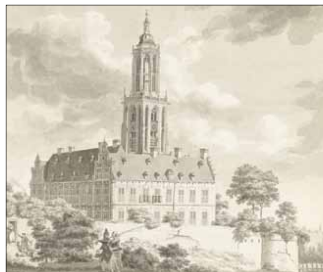
Koningshuis met de Cuneratoren, Rhenen. Potlood, pen en penseel, Hendrik Hoogers, 1771, Rijksmuseum.

Op 30 juli 1794 kwam de oorlog de kamer van de Staten van Utrecht binnen. Een Engelse officier bracht een verzoek van de Britse opperbevelhebber, de hertog van York, tweede zoon van koning