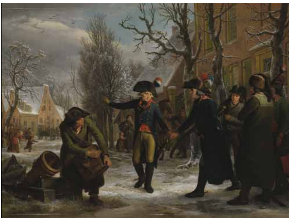
Oud-patriot Herman Daendels (in Frans generaalsuniform) neemt afscheid van mede-patriot Cornelis Kraijenhoff, te Maarsssen, op 19 januari 1795. Olieverf, Adriaan de Lelie, Egbert van Driest, 1795, Rijksmuseum.

duizenden Engelsen op weg naar het noorden konden ze de stad niet uit. De bestuurders van Wijk bij Duurstede en Rhenen waren al ingelicht op de terugreis van de commissie naar Utrecht. De generale staf van Pichegru en Franse afgevaardigden reisden door naar Amsterdam en Den Haag om de Franse bezetting te completeren. Op 18 januari bezetten de eerste Fransen Amersfoort. Diezelfde dag vertrok stadhouders Willem V in een vissersboot van het strand van Scheveningen naar Groot-Brittannië. Hij zou nooit meer terugkeren en overleed in 1806. De Republiek, of tenminste de oude vorm daarvan, hield op te bestaan.