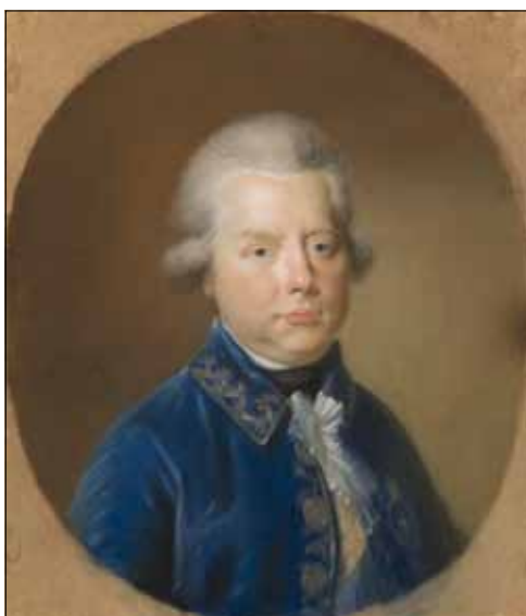
Willem V Batavus (1748-1806), Prins van Oranje, erfstadhouder van de Republiek der Verenigde Nederlanden (1751-1795). Pastel op perkament, Johann Friedrich August Tischbein, 1789, Rijksmuseum.

De bevolking van Utrecht merkte een jaar lang niet veel van de oorlog. 4 Of het moet de lange stoet van 75 wagens zijn die in de stad gemaakt waren en als 'veldtrein' van munitie-, brood-, smids- en bagagewagens naar het zuiden trok. Ook waren er natuurlijk brieven uit het zuiden, berichten in de Utrechtsche Courant en biddagen in de kerken voor steun van de Allerhoogste in de oorlog. Er waren regimenten die terugkeerden van gevechten in het zuiden en garnizoensdiensten innamen in Utrecht of Amersfoort. Maar tot halverwege 1794 was het een verre oorlog. Het gedreun van kanonnen in de verte was alleen vaag te horen in februari 1793 bij de beschietingen van Willemstad. 5