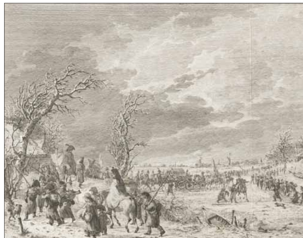
Fransen trekken over het ijs de Bommelerwaard binnen, 27 december 1794. Tekening, anoniem. Rijksmuseum.

In de loop van december kregen de Fransen er echter een belangrijke bondgenoot bij: de vorst. Op 16 december, toen de Franse opperbevelhebber generaal Pichegru na een kort ziekteverblijf in Brussel weer terugkeerde in 's-Hertogenbosch, begon een lange vorstperiode. Op 19 december moesten de Hollandse officieren het werk aan de batterijen aan de Lek en aan de Grebbe staken vanwege de dalende temperatuur. De Maas was al snel dichtgevroren en op de Waal, Rijn en Lek dreven ijsschotsen. Het verhaal over de Fransen die de Republiek binnenliepen over het ijs, begon zich hier te ontwikkelen. Maar zo eenvoudig was het niet. In de Betuwe dreigden bijvoorbeeld in november en december al enkele eenheden van de Fransen over de bevroren inundaties op te trekken. Maar prins Frederik, de tweede zoon van de stadhouder, liet daar de sluisen openen, zodat het water ging stromen en het ijs te zwak werd. Er werden 1.200 arbeiders ingezet om het ijs open te hakken. Zo deed men er alles aan om de doorgang over het ijs