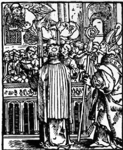
Bisschop Willibrord verheft het gebeente van Cunera. Een van de houtsnedden uit het boekje „Dat leven van Kunera...“, van ca. 1515.

Hoe verliep zo'n week? Zoals gezegd, er is geen enkele beschrijving van overgeleverd. Wel kan uit de rekeningen, in enkele archieven bewaard, het een en an-