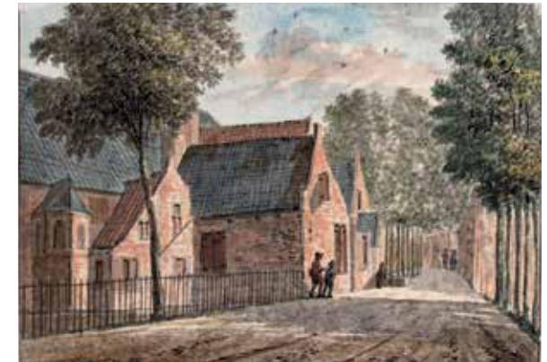
Binnenplaats van logement De Doelen waar in 1794 officieren ingekwartierd zijn geweest.

Een andere cavalerie-eenheid, de Huzaren van York, wordt gesplitst. De manschappen en