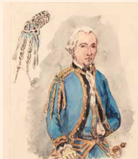
Ingenieur van het Staatse leger. Aquarel, W.C. Staring, 1779 (Collectie Legermuseum).

daten hielden behoorlijk huis in onze gewesten. 2 Zes jaar later, vanaf 1793, waren het Duitse Hessen en Hannover ineens onze bondgenoten tegen de gemeenschappelijke vijand, de Fransen. Met al deze oude vriend- en vijandschappen was de coalitie van de republiek met haar bondgenoten in deze oorlog op zijn minst wankel.