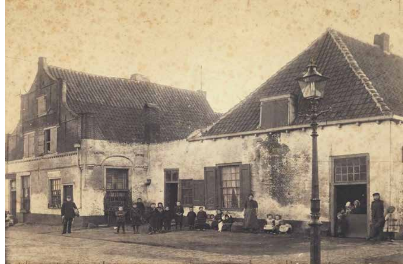
17 e -eeuwse boerderij en pakhuis aan het Sint Janskerkhof, waar in 1794 een loods voor inkwartiering van troepen werd gebouwd. Foto, 1943.