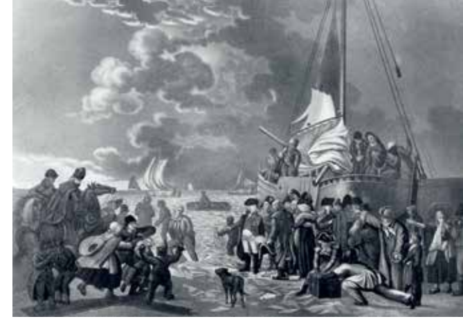
Vertrek van stadhouder Willem V naar Groot-Brittannië, 18 januari 1795. Willem Hendrik Hoogkamer, 1795 Atlas van Stolk.