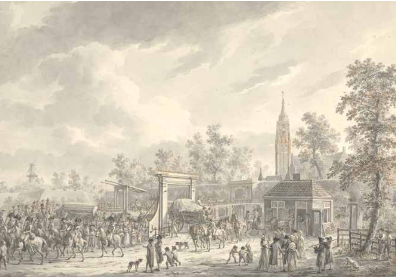
Cavalerie verlaat Amersfoort. Tekening, Dirk Langendijk, 1790. Collectie Rijksmuseum.

Staatshoofden betrokken bij coalitieoorlog in 1793-95 en hun onderlinge relaties.