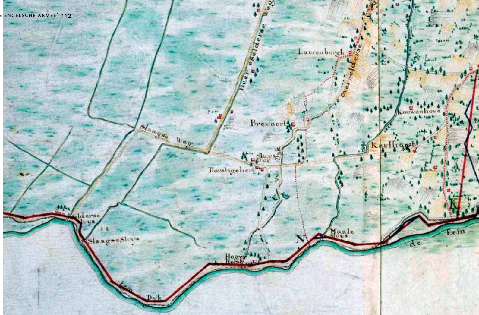
Kaart van traject Grebbelinie ter hoogte van Vudijk (midden), met sluisen en de oevers van de Eem. Handgetekend, 1745.

voor de gevolgen: landerijen die nu al erg drassig zullen worden, wegen die moeilijk begaanbaar zullen zijn. Ook de dijkgraven en heemraden van de waterschappen worden ingelicht. Met alleen deze voorbereidingen lopen de laagst gelegen landerijen al onder water.