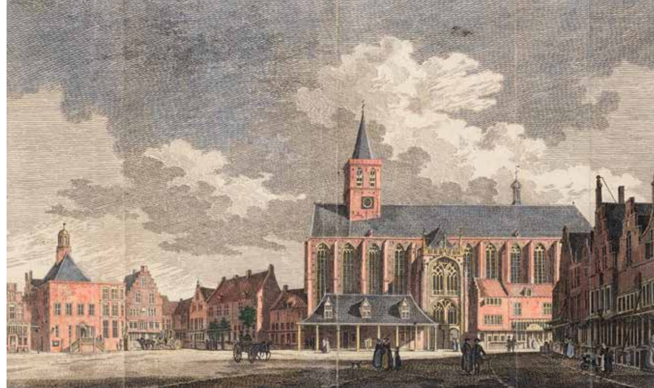
Sint-Joriskerk in Amersfoort, vanaf 30 december 1794 gevorderd als Brits hospitaal. Gravure, Paulus van Liender, 1759.