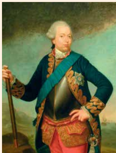
Willem V Batavus (1748-1806), Prins van Oranje, Vorst van Nassau-Dietz, erfstadhouder van de Republiek der Verenigde Nederlanden (1751-1795) Collectie Museum Flehite