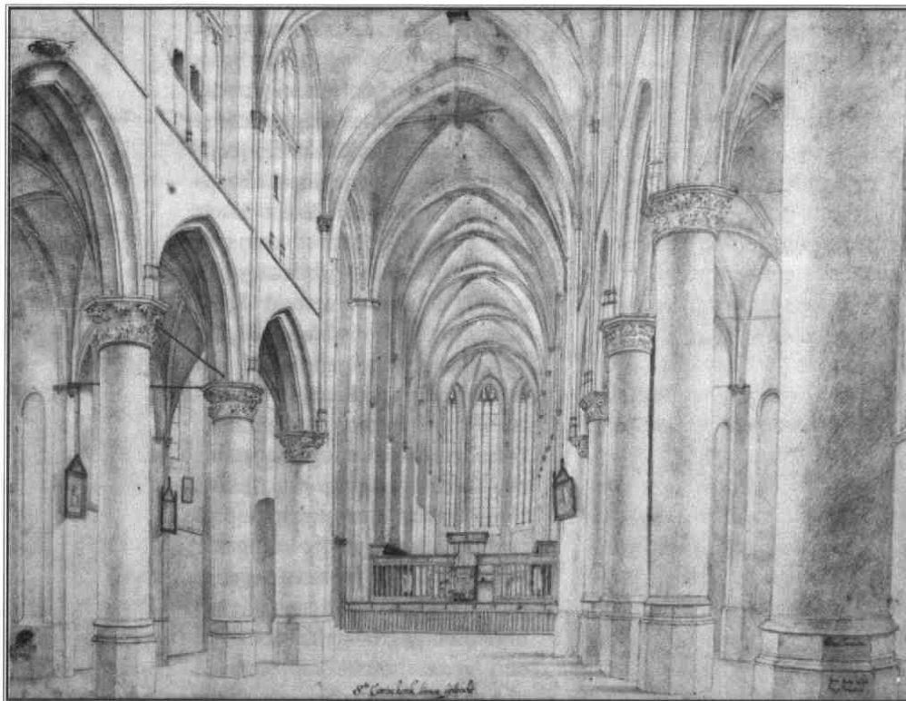
Saenredam, Catharijnek kerk gezien vanuit het schip naar het koor (1636)

bij tentoonstellingen met kostbare en kwetsbare voorwerpen. Ook controleren de meegereisde koeriers lichtsterkte, luchtvochtigheid en temperatuur en stellen ze met de restauratoren van het ontvangende museum eventuele beschadigingen vast. Aan het eind van de tentoonstelling worden de stukken aan de hand van foto's en aantekeningen opnieuw bekeken, zodat kan worden vastgesteld of er tijdens het bruikleen beschadigingen zijn opgetreden.