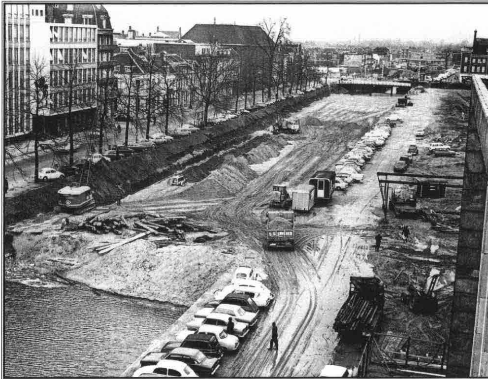
Drooglegging van de Catharijnesingel, januari 1971

de stedelijke omgeving - de Bemuurde Weerd, de Leidsche Rijn - vormde een belangrijk actiepoint. Om het verkeersprobleem aan te pakken pleitte de werkgroep voor goedkoop openbaar vervoer in de binnenstad.