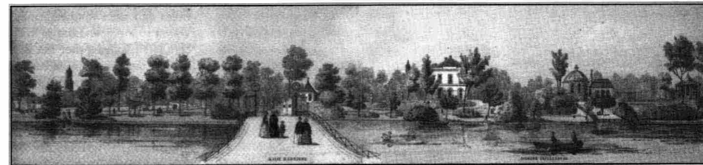
Gezicht op de Maliesingel met de nog bestaande Maliebrug en rechts het voormalig bolwerk Lepelenburg Fragment uit Panorama de Weijer 1859

langrijk deel van deze oorspronkelijke bebouwing bewaard gebleven. De door de afbraak van de omwalling vrijgekomen ruimte was deels benut om openbare gebouwen neer te zetten, zoals universiteitsge-