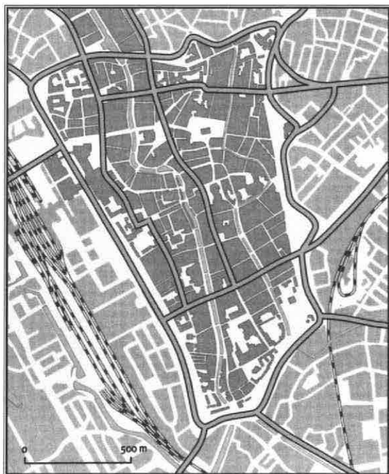
Verkeersplan Feuchtinger met ringweg, doorbraken en wegverbredingen Tekening Maarten Sloves overgenomen uit Buiter, Hoog Catharijne (1993)

bolwerken, die reeds in de 18e eeuw een vervallen indruk maakten, als de singel of stadsbuiten-gracht ongemoeid liet. Ook in Utrecht veranderde de functie van het water door de economische ontwikkelingen. De industriële ontwikkeling van de stad raakte rond 1880 in een stroomversnelling, zodat ingrepen nodig waren om de aanvoer van grondstoffen te regelen. De Catharijnesingel vormde niet langer een doorgaande route. Met de opening van het Merwedekanaal in 1892 was de Keulse Vaart in één klap overbodig geworden. Door toenemende concurrentie van elders en door de komst van de spoorwegen nam bovendien het belang van de vaartroutes als geheel rond 1900 snel af. De spoorwegen namen een steeds groter gedeelte van het goederenvervoer voor hun rekening. Rond 1900 fungeerde Utrecht al als spoorwegknooppunt. Met de afnemende economische betekenis van de scheepvaart op de kleinere binnenwateren heeft het water zich als het ware uit de stad teruggetrokken. Tot de Tweede Wereldoorlog nam de verkeersdruk in de Utrechtse binnenstad zodanig toe dat het gemeentebestuur