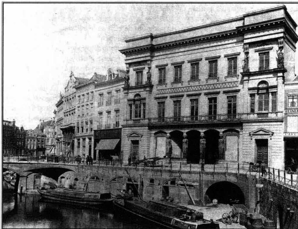
Handelsactiviteit aan de Oudegracht, ca. 1890

recht. Het idee om rijke handelaren naar de stad te trekken bleef dan ook grotendeels in goede bedoelingen steken. Tegenwoordig rest ons nog de tussen station en Croeselaan verborgen Kruisvaart als stille getuige van de plannen van Moreelse.