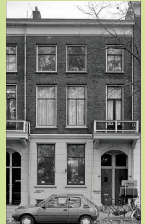
(28) Tolsteegsingel 37 - 37bis in 1987.

Het boek kent een surrealistische, bijna magisch-realistische sfeer, die doet denken aan de schilderijen van Pyke Koch en J.H. Moesman. Daarmee is Brouwer de eerste schrijver in Nederland en zijn tijd ver vooruit: