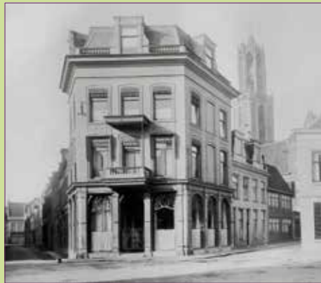
(11) Pausdam in 1928 met rechts Achter de Dom en links de Trans.

□ FOTO E.A. VAN BLITZ EN ZN | HUA, BEELDMATERIAAL