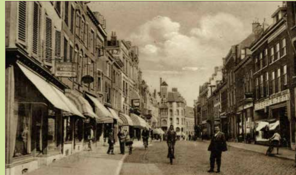
(15) Oudkerkhof zoals het eruit zag tijdens Crones jeugdijaren.

'In het Hiëronymusplantsoen wees alles erop, dat het lente werd. Hij dacht aan het landschap, dat op het draaiorgel geschilderd stond. Daarna ging hij langs Lepenburg en Servaesbolwerk naar Manenborch. [...] Het klokkenspel van de Klaastoren klonk