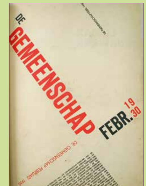
(2) Omslag De Gemeenschap februari 1930.