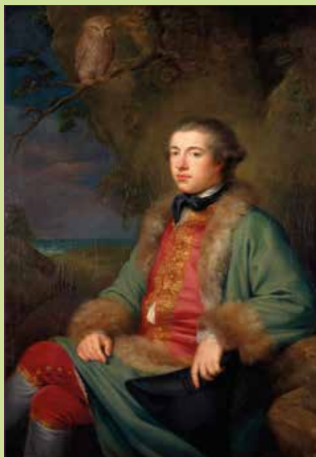
(12) James Boswell in 1765, geschilderd door George Willison.

Ga naar rechts en meteen naar links (Achter de Dom). Indien geopend, kunt u via het poortje links de pandhof van de Domkerk inlopen.