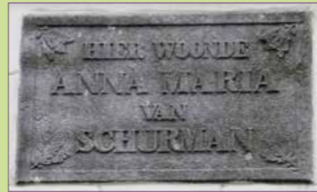
(13) Gevelsteen Achter de Dom 8.

'O Utrecht, lieve stad, hoe zoud' ik U vergeten Als ver van U mijn dagen zijn versleten.'