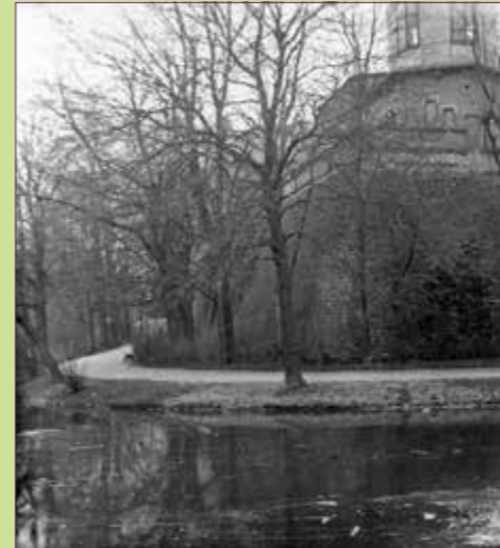
(27) De Sterrenwacht, ca. 1920.

Ga aan het eind van de Herenstraat naar rechts. Loop langs park Lepenburg en ga na de Brigittenstraat - de Bruntenhof in. Op het eind kunt u via de Schalkwijkstraat in de binnentuin van de hofjes het beeldje Man met schuiftrompet zien, een ode aan het werk van C.C.S. Crone (26). Vervolg uw weg door het singelplantsoen. U komt uit bij de Sterrenwacht.