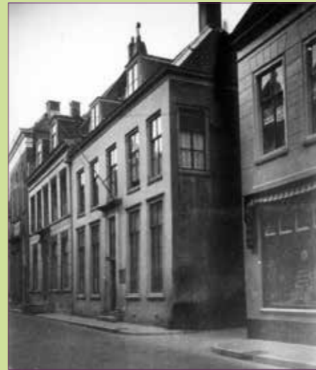
(24) De Herenstraat met rechts de Jeruzalemstraat in 1940.