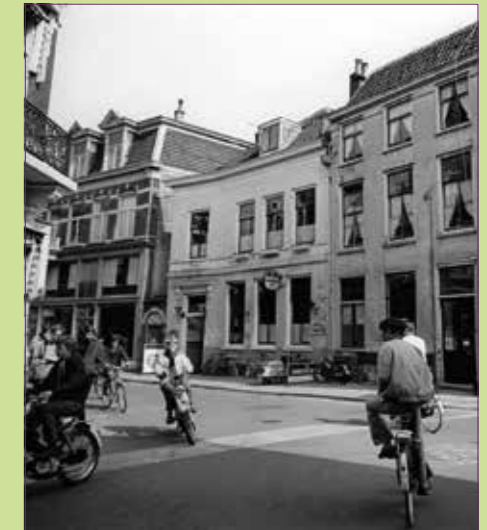
(18) Het Wed ca. 1970 met in het midden café 'vanouds De Vriendschap'.

'Maar ik zag, helaas! te Utrecht het eerste levenslicht, en daar kan men geene eieren koken in het zand, en in den schaduw van dien langen, vervelende domtoren blijft men altijd koud.'