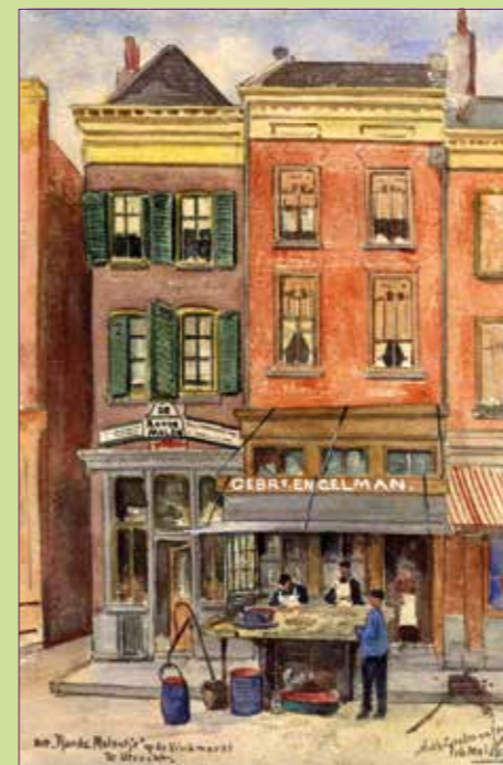
(16) Vishandel van de gebroeders Engelman, Vismarkt 13 in 1895.

Vismarkt 13, nu café-restaurant Graaf Floris (16) is het geboortehuis van de katho-