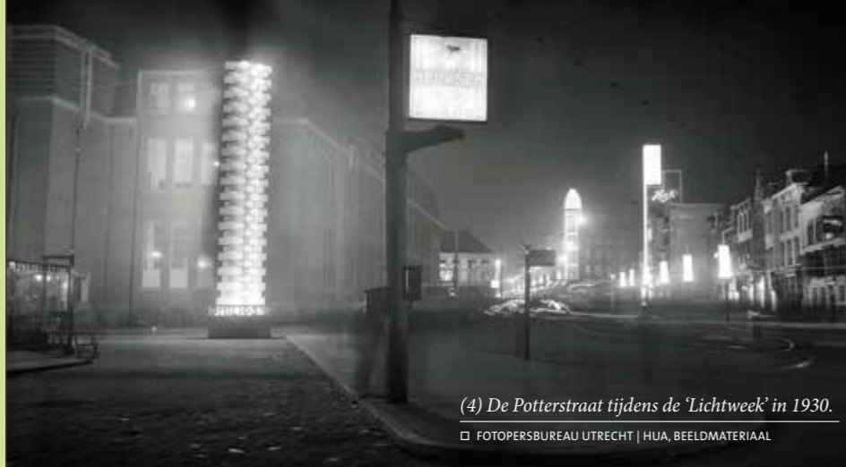
(4) De Potterstraat tijdens de 'Lichtweek' in 1930.