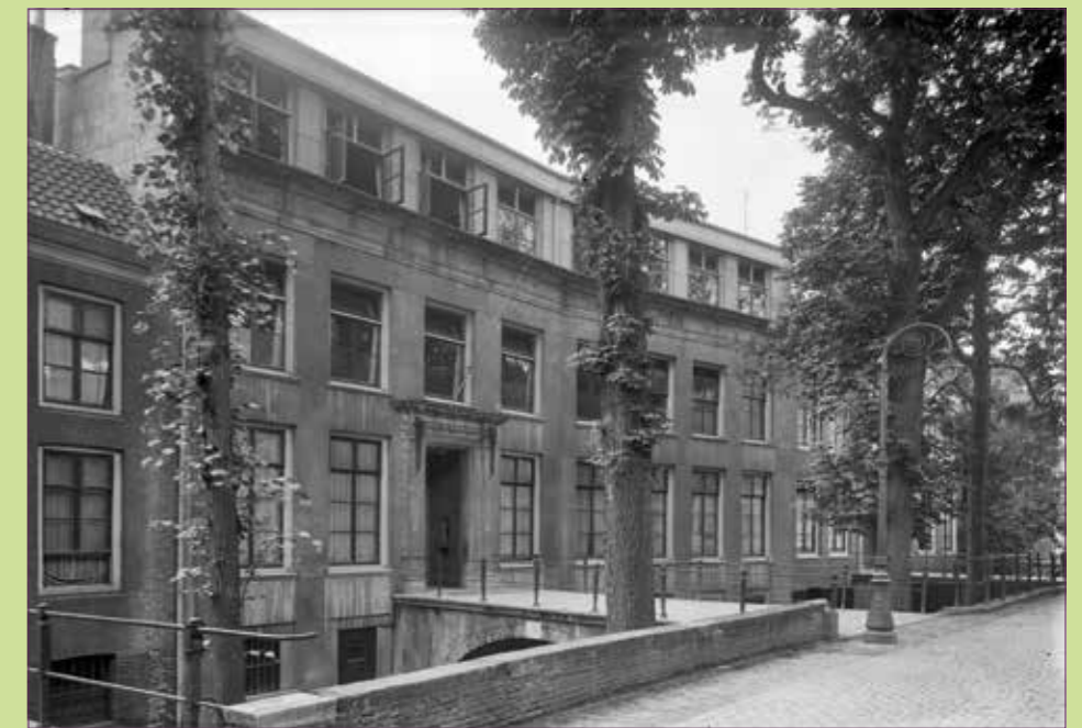
(8) Bonifatiuslyceum in 1930.

'Pas veel later, toen ik reeds in New York was, heb ik de bekoring ondergaan van de oude middeleeuwse stad die Utrecht is.'