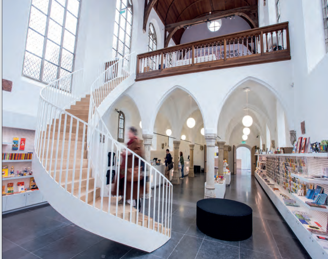
De nieuwe winkel van het museum

Op nog twee plekken ontbreekt het zicht op de omgeving. In de Stallen zitten nissen die zicht geven op het heerlijke groen van Zocher langs de Singel. Ook de meeste hiervan waren medio 2016 dichtgezet. En ooit kon je door de ramen van de derde verdieping van de 1920-vleugel de middeleeuwse stad zien liggen. Je moet tenslotte toch naar de Dom kunnen kijken vanuit het museum dat je 'de wereld van Utrecht' wil laten ontdekken. Die hele derde verdieping kan trouwens beter worden benut, wie weet met een soort van half