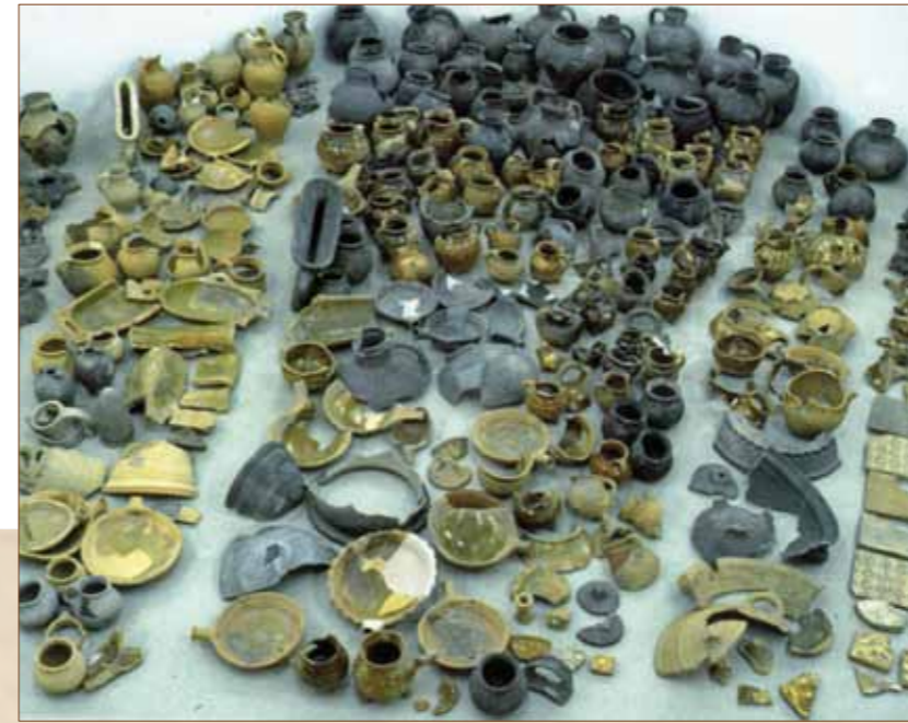
Bij de Oudenoord is in 1984 een aantal pottenbakkersovens opgegraven en een groot aantal kuilen vol misbakfels. Deze foto geeft een goede indruk van de variëteit aan aardewerk dat hier omstreeks de 14e eeuw vervaardigd werd.

Tarq zelf groef al enige tijd niet meer op, maar besteedde veel tijd aan Kerken Kijken, Open Monumentendag en het over het voetlicht brengen van het onderzoekswerk. De kennis die de onderzoeken onder en boven de grond opleverden, verdienden het om onder een groot publiek verspreid te worden. Daartoe heeft een tijdlang ook de Archeologische en Bouwhistorische Kroniek gefunctioneerd, maar deze is 'onder zijn eigen gewicht bezwiken' aldus Tarq. Het schrijfwerk moest immers allemaal in de avonduren gebeuren en dat was voor de medewerkers op een gegeven moment te veel. Van 1988 tot en met 2005 heeft nog wel een provinciale archeologische kroniek gefunctioneerd, maar het lukte niet om de bouwhistorie hierbij onder te brengen, wat hij zeer betreunde. En na 2005 schakelde de archeologie vanwege de nieuwe wetgeving over op verplichte verslaglegging in de basisrapportages archeologie. 'Nuttig, maar niet echt lekker leesbaar', aldus Tarq.