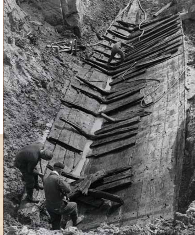
Een groot platboomvaartuig is gevonden in de bouwput van de Nederlandsche Bank aan de Waterstraat in Wijk C. Het schip is over een lengte van ruim 22 meter bewaard gebleven. Het gehele schip is met houten penen in elkaar gezet.