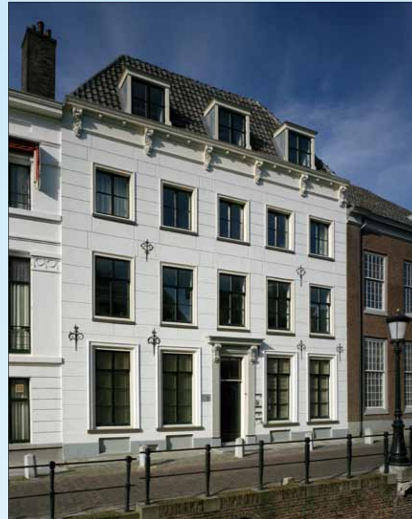
Het huis Plompstorengracht 24 in 1988.