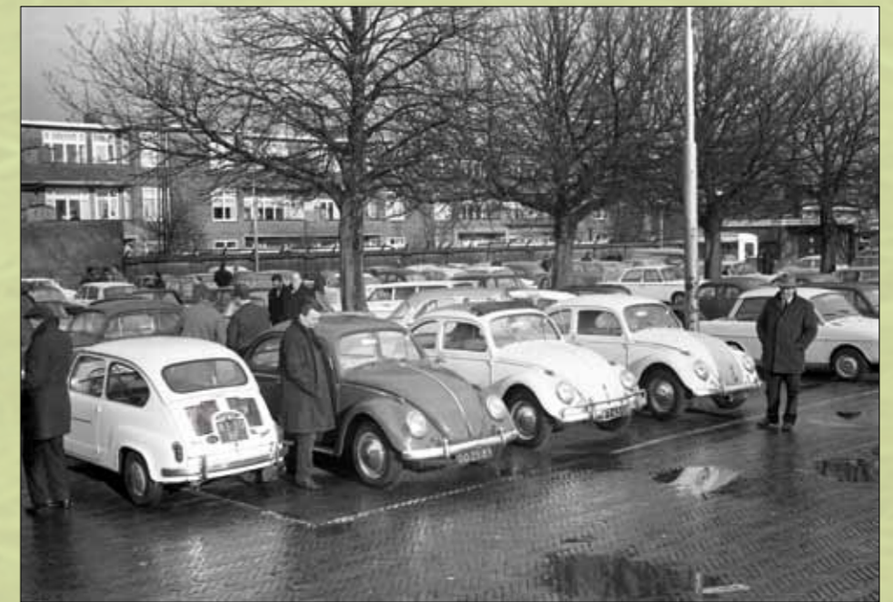
Automarkt op het Veemarktplein (Croeselaan), tweede helft jaren zestig

Ondanks uitgebreide protesten van veehandel en andere betrokkenen ging de Utrechtse gemeenteraad in september 2008 akkoord met sluiting van de vee-