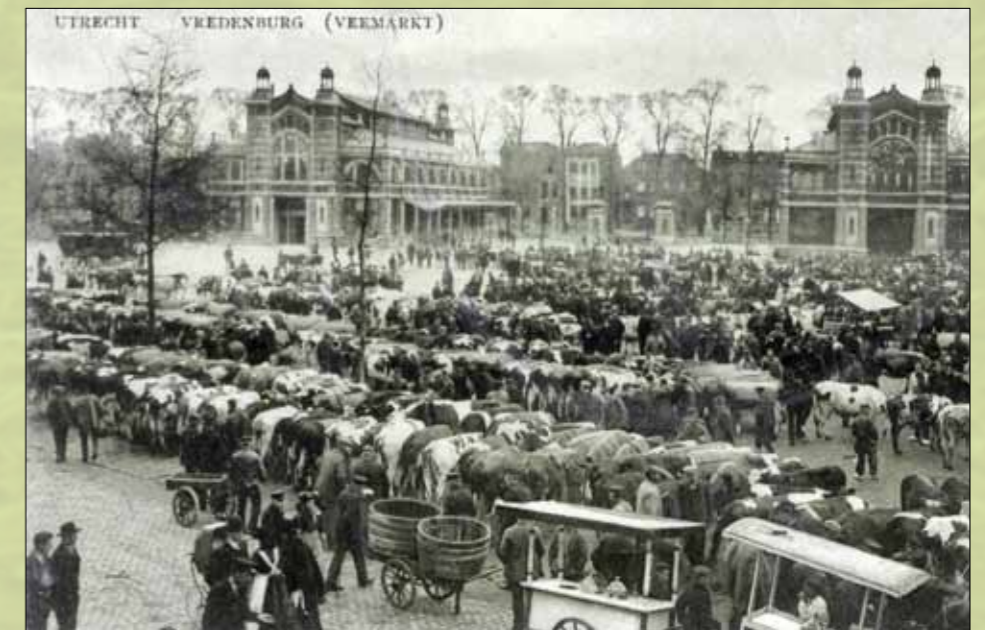
Veemarkt op het Vredenburg, ca 1905 - 1910; op de achtergrond de Korenbeurs (links) en de Fruithal (rechts).

Het was even wennen op de nieuwe locatie. Aan het Vredenburg zat de markt in het hart van de stad: volop horeca, winkels en vertier, ook voor de vrouwen van de veeboeren, die vaak meekwamen voor de gezelligheid en om in de stad inkopen te doen. De nieuwe markt aan de Croeselaan kende niet de 'natuurlijke' gezelligheid van