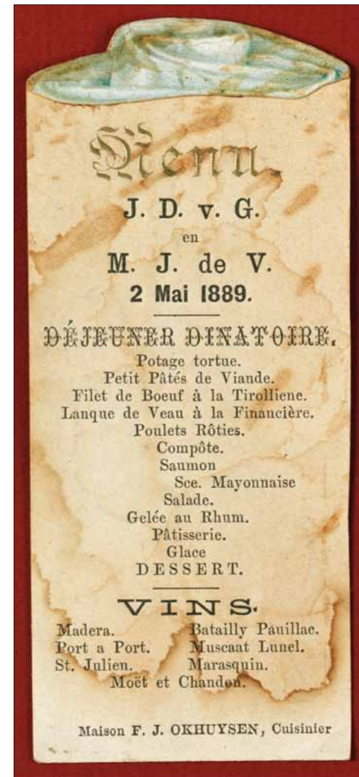
Menukaart Maison Okhuysen, 1889.

Na de oorlog was het bedrijf in toenemende mate in staat om weer diners en recepties te verzorgen. De maaltijden waren bonvrij maar gebak en zout moest de klant zelf leveren. Op 15 oktober 1945 liet Huize Molenaar aan een klant uit Groningen weten dat er tijdens de promotiereceptie 'een goed theesurrogaat' geschonken kon worden. Ook kon er na afloop van de receptie dankzij grotere elektriciteitstoewijzing een warme maaltijd à f 10,- per persoon geserveerd