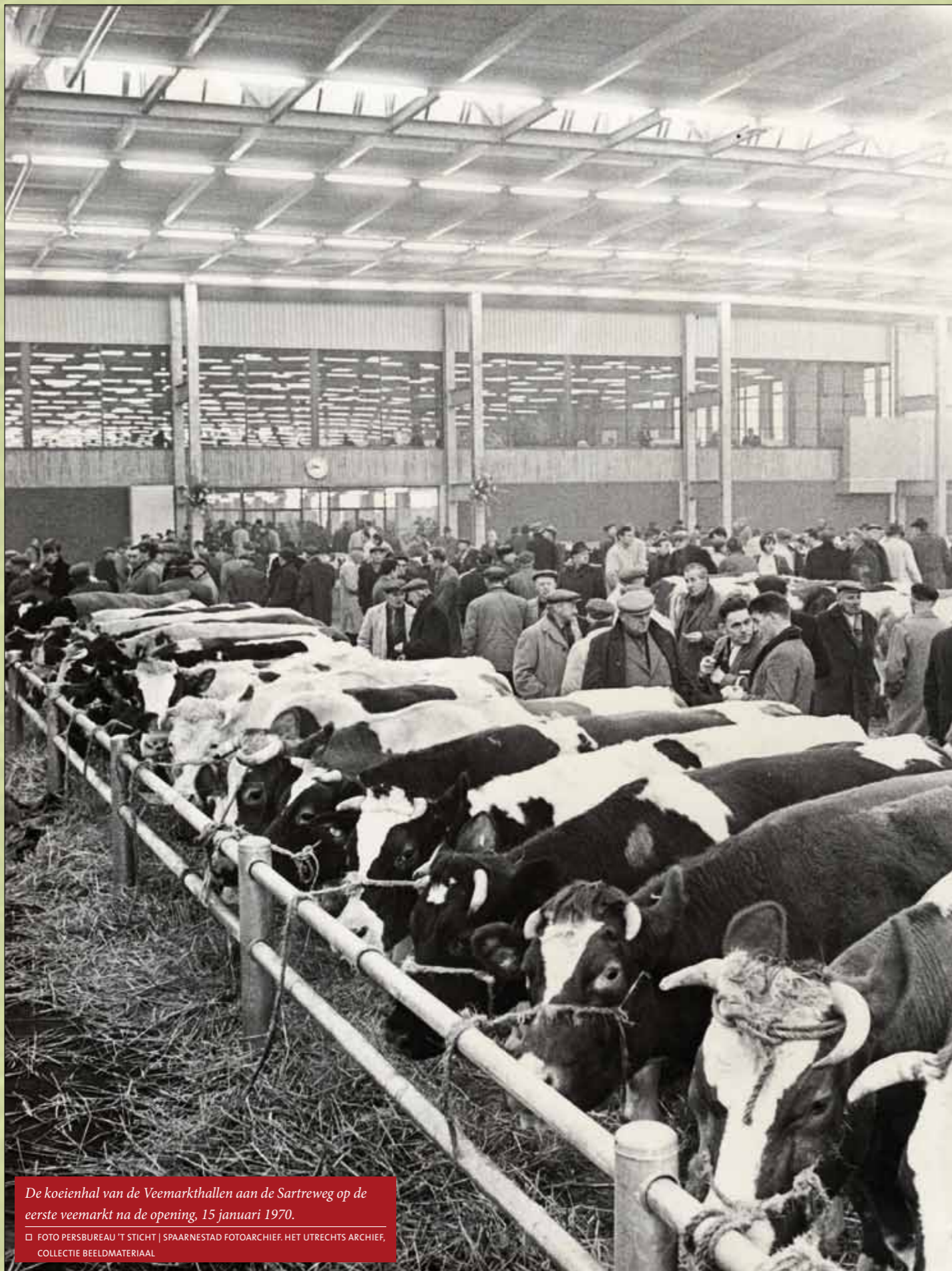
De koeienhal van de Veemarkthallen aan de Sartreweg op de eerste veemarkt na de opening, 15 januari 1970.