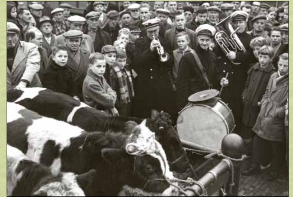
Laatste zaterdagse veemarkt aan de Croeselaan, 18 november 1961.