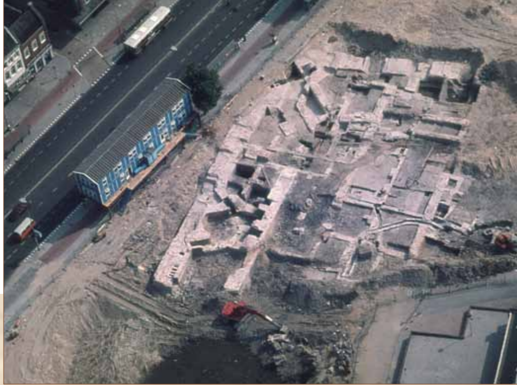
Vanuit de lucht is de opgraving op het Vredenburg uitstekend zichtbaar. Zowel de fragmenten van het Johanniterklooster als van kasteel Vredenburg zijn blootgelegd (augustus 1976).