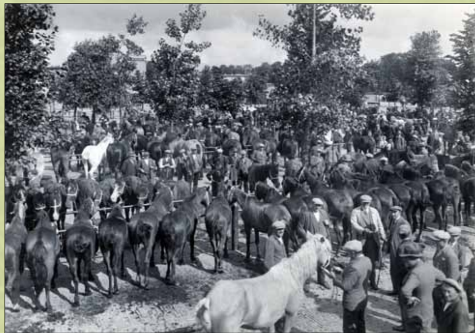
Paardenmarkt aan de Croeselaan, jaren dertig

Ondanks het economische succes besloot de gemeente Utrecht dat de veehandel weer moest verhuizen. De Jaarbeurs - van minstens even groot economisch belang voor