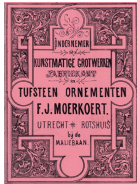
^ Titelpagina van de catalogus van Moerkoert, circa 1881.

Ornament en kunstzandsteen fabricage'. Lutters was gevestigd aan de F.C. Dondersstraat 5-7, waar ze een 'buitenetalage' hadden die nog tot omstreeks 1970 zichtbaar was voor passanten, maar helaas is gesloopt. Van hen is geen oeuvre bekend, en wellicht hebben ze zich meer op bouwornamentiek (trappen, balkons) gericht dan op bouwwerken zelf. In de jaren 1920 concentreerden zij zich meer en meer op de fabricage van betonnen rioolbuizen, beerputten, dakpannen en dergelijke. 2