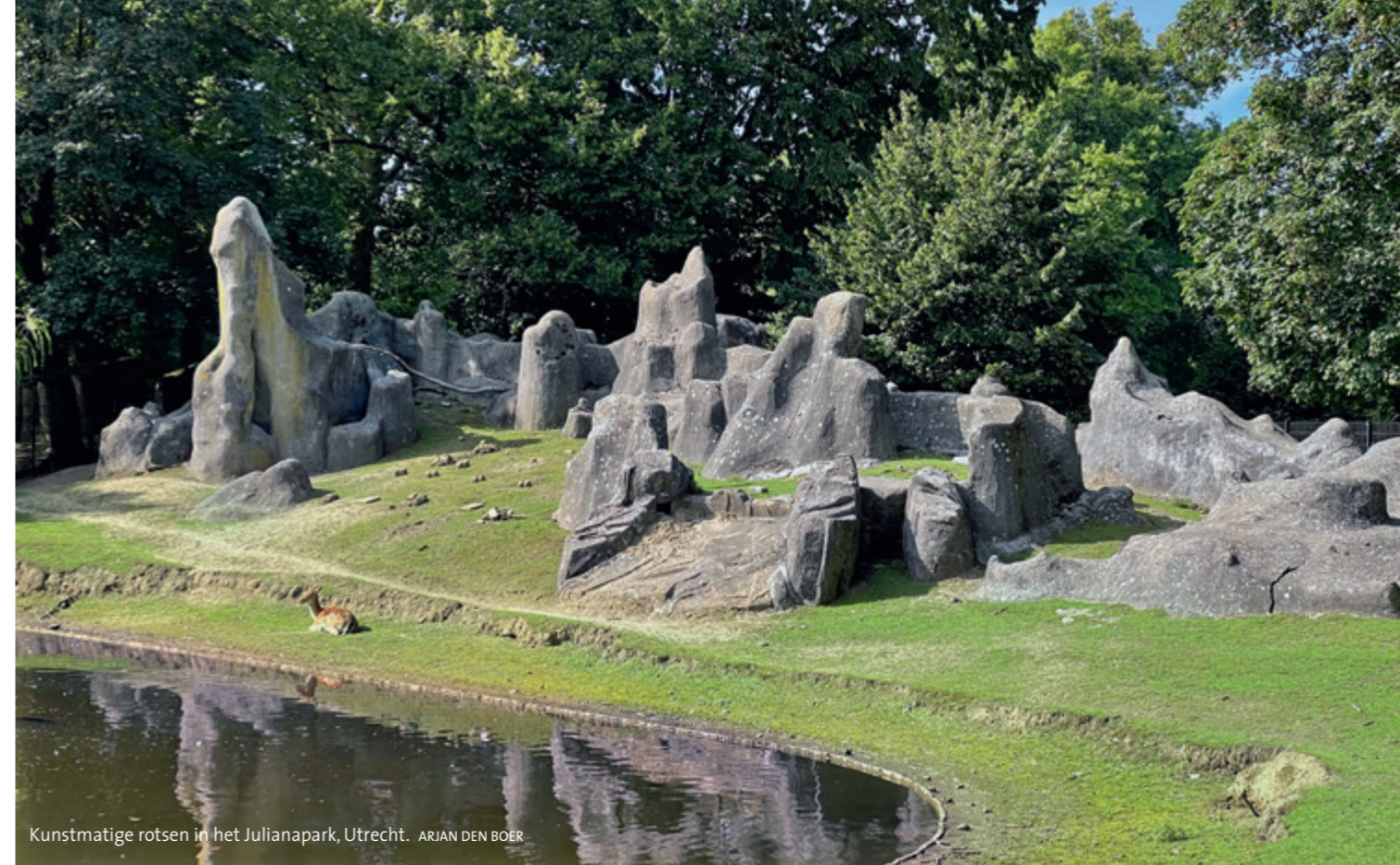
Kunstmatige rotsen in het Julianapark, Utrecht. ARJAN DEN BOER