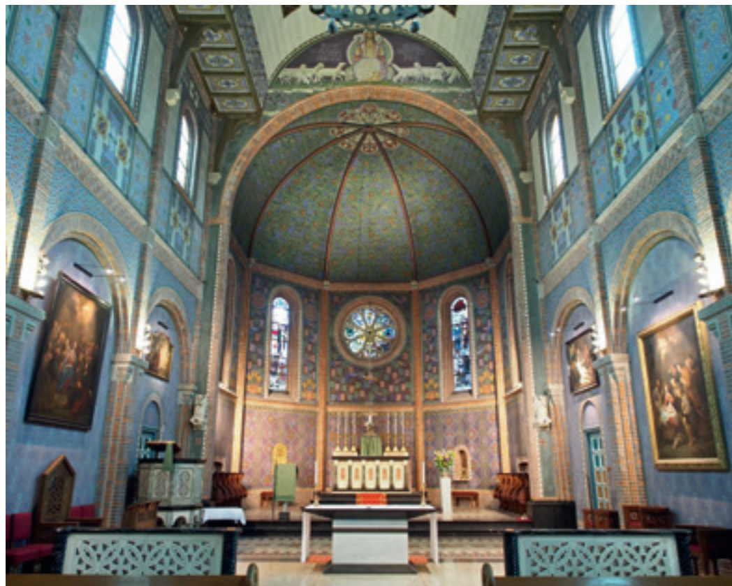
▲ Koor en absis van de Gertrudiskathedraal met schilderijen door Anton Federle. ARJAN DEN BOER