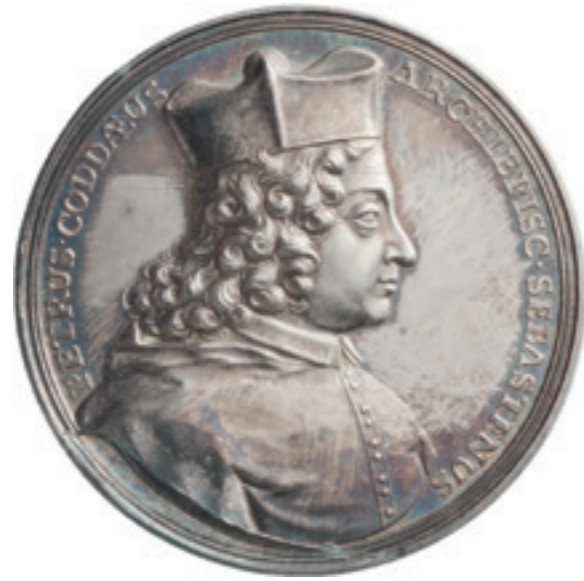
▲ De geschorste apostolisch vicaris Petrus Codde, zilveren penning uit 1705.

Deze crisis leidde tot de breuk. In 1723 besloten katholieken in de Noordelijke Nederlanden om zelf een bisschop te kiezen - zonder toestemming van Rome. 3 De verkozen kandidaat was de Utrechtse priester en vicaris-generaal Cornelis Steenoven (1661-1725, in functie 1723). Een jaar later ontving hij de bisschops-