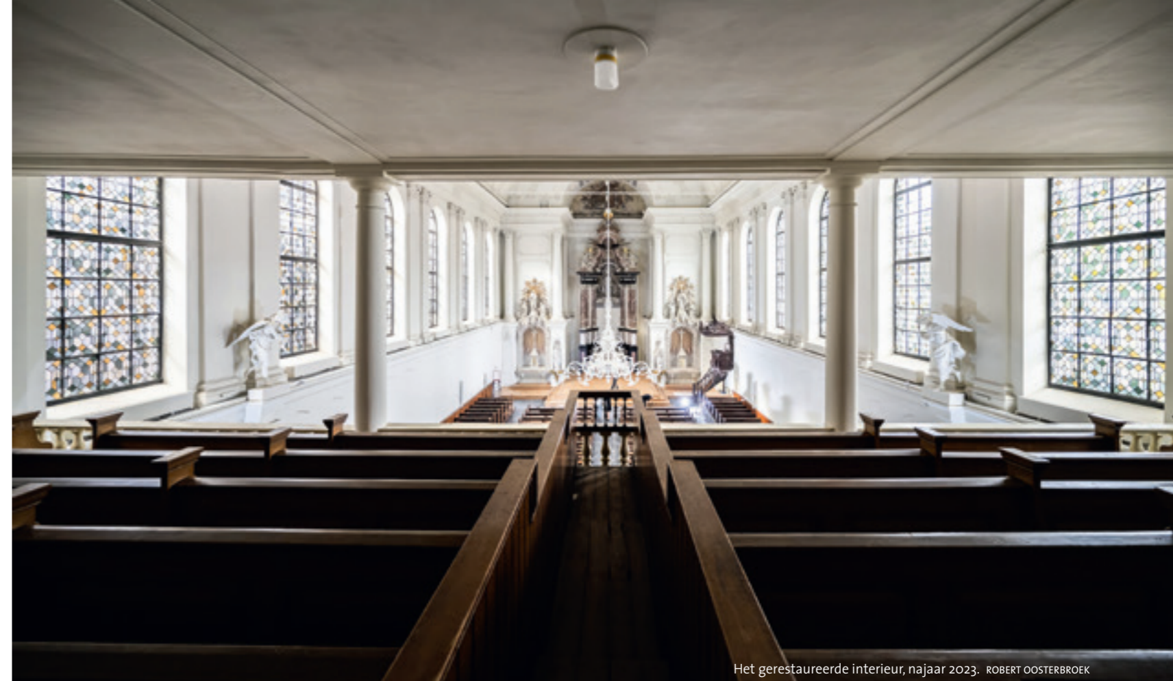
Het gerestaureerde interieur, najaar 2023. ROBERT OOSTERBROEK