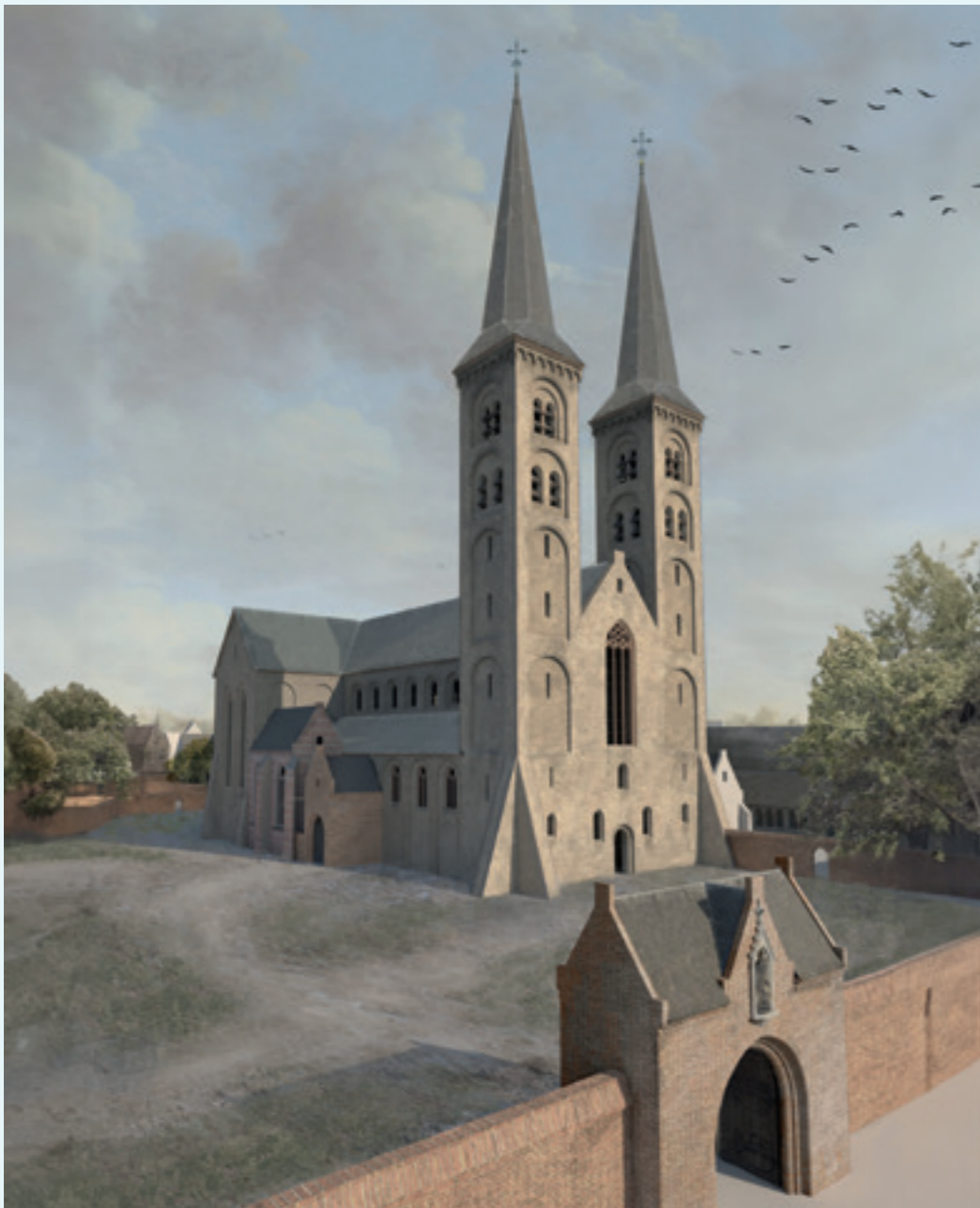
3D-reconstructie van de 16e-eeuwse Pieterskerk, westfaçade met twee torens en de muur van de immunitet op de voorgrond. ERFGOED GEMEENTE UTRECHT, DAAN CLAESSEN

Bij de grote stormramp van 1674 waaiden de torenspitsen van het schip, dat daardoor vernield werd. Er was ook veel schade binnen de kerk, onder andere het orgel was verwoest. In de jaren daarna werd de kerk hersteld, maar de torens werden afgebroken. Na aankoop van het kerkgebouw in 1823 is de Eglise Wallonne d'Utrecht tot op heden eigenaar van de kerk. De laatste grote renovatie en restauratie vond plaats tussen 1963 en 1977. Tegenwoordig is er elke zondag een Franse kerkdienst voor de weinige Waalse kerkleden en andere belangstellenden. Vanwege de goede akoestiek wordt de kerk veel gebruikt voor concerten en ook voor de Van der Monde-lesing van Oud-Utrecht.