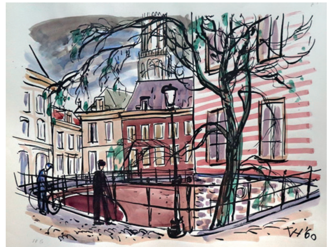
▼ Litho Kromme Nieuwegracht / Trans , 1960.