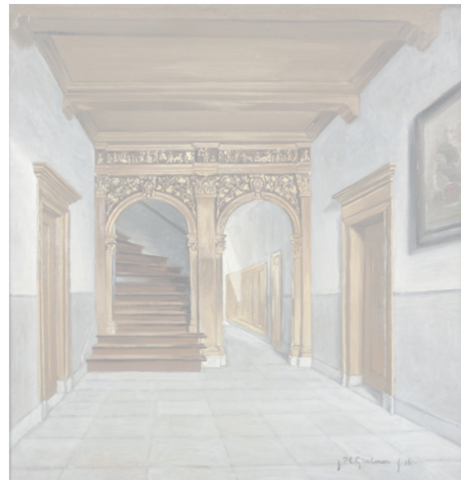
↳ De vestibule van Oudegracht 35, geschilderd door Johan Paul Constantinus Grolman, 1886.