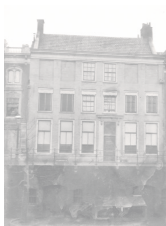
▲ Oudegracht 35, het ouderlijk huis van Boellaard dat zij naliet aan Kunstliefde, in 1905 gefotografeerd door Joh. A Moesman. HET UTRECHTS ARCHIEF

verrassend aantal te vinden is in de depots van Nederlandse musea. Niet alleen Boijmans van Beuningen, maar ook het Centraal Museum, het Rijksmuseum en het Westfries Museum bezitten schilderijen of tekeningen van Boellaard. Boellaards liefde voor de kunst liep als een rode draad door haar leven. Haar toewijding daaraan blijkt uit haar inzet als kunstenaar, verzamelaar en begunstiger. Door het geven van kunstbeschouwingen, waarbij zij haar collectie en kennis deelde met anderen, was zij tot op hoge leeftijd nauw betrokken bij de kunstwereld. Ook na haar overlijden bleef zij een stempel drukken op de Utrechtse kunstwereld: haar nalatenschap aan het genootschap Kunstliefde zorgt nog altijd voor de bevordering van de kunsten in Utrecht.