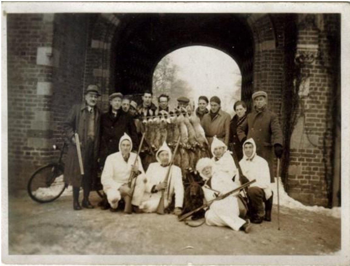
Jagers in de winter van 1946/1947